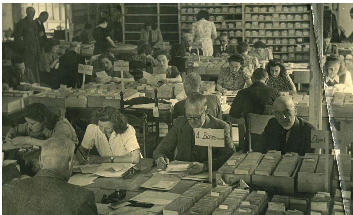
Informatiebureau Rode Kruis, kort na de Tweede Wereldoorlog.